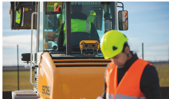
Solution Blaxtair sur une chargeuse

Paris, le 12 janvier 2021 – Arcure, spécialiste de l'intelligence artificielle appliquée au traitement d'image dans l'univers industriel, a retenu Objenious, marque IoT du groupe Bouygues Telecom, comme partenaire de sa solution Blaxtair Connect. Unique au monde et déjà primée à l'international, cette solution connectée se positionne comme un futur acteur majeur de la prévention et de la sécurité industrielle.